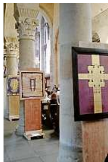
Die Grundrisse sind im Kirchenschiff ausgestellt.

Die Vorbilder für die Hagia Sophia waren Salomons Tempel in Jerusalem und das Pantheon in Rom. Die Kirche San Vitale in Ravenna knüpft an die Justinianischen Bauten in Konstantinopel an, und Karl der Große nahm San Vitale als Vorbild für seine Pfalzkapelle in Aachen. Und was hat die Justinuskirche in Höchst mit Ravenna zu tun? Einiges! Gebäudegrundrisse haben eine eigene Faszination. Allein ihre Grafik hat schon einen künstlerischen Wert. Martin Plum zeigt in der Justinuskirche mit „monumental“ außergewöhnliche, auch sonderbare Grundrisse. „Es wird klar, dass gerade geschichtlich und bauhistorisch bedeutende Bauwerke Grundrisse haben, die alleine schon Harmonie und Erhabenheit ausstrahlen“, sagt er. Schon im Bau-