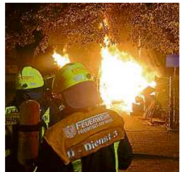
In Griesheim musste die Feuerwehr um Mitternacht herum zu mehreren Kleinbränden ausrücken. Immer wieder brannten Müllcontainer oder Sperrmüllhaufen.

Die Einsatzkräfte lokalisierten einen Brand im Tiefgeschoss des Gebäudes und rückten mit zwei Trupps unter Atemschutz vor. Wie sich herausstellte, brannte im Tiefgeschoss Unrat, der schnell gelöscht werden konnte. Die weitläufig verrauchte Tiefgarage musste mit zwei Überdrucklüftern entraucht werden. Insgesamt waren 25 Einsatzkräfte der Feuerwehr vor Ort. Während der Lösch- und Entrauchungsmaßnahmen kam es zu Behinderungen des Straßenbahnverkehrs, weil die Gleise auf der Bolongarstraße blockiert waren.